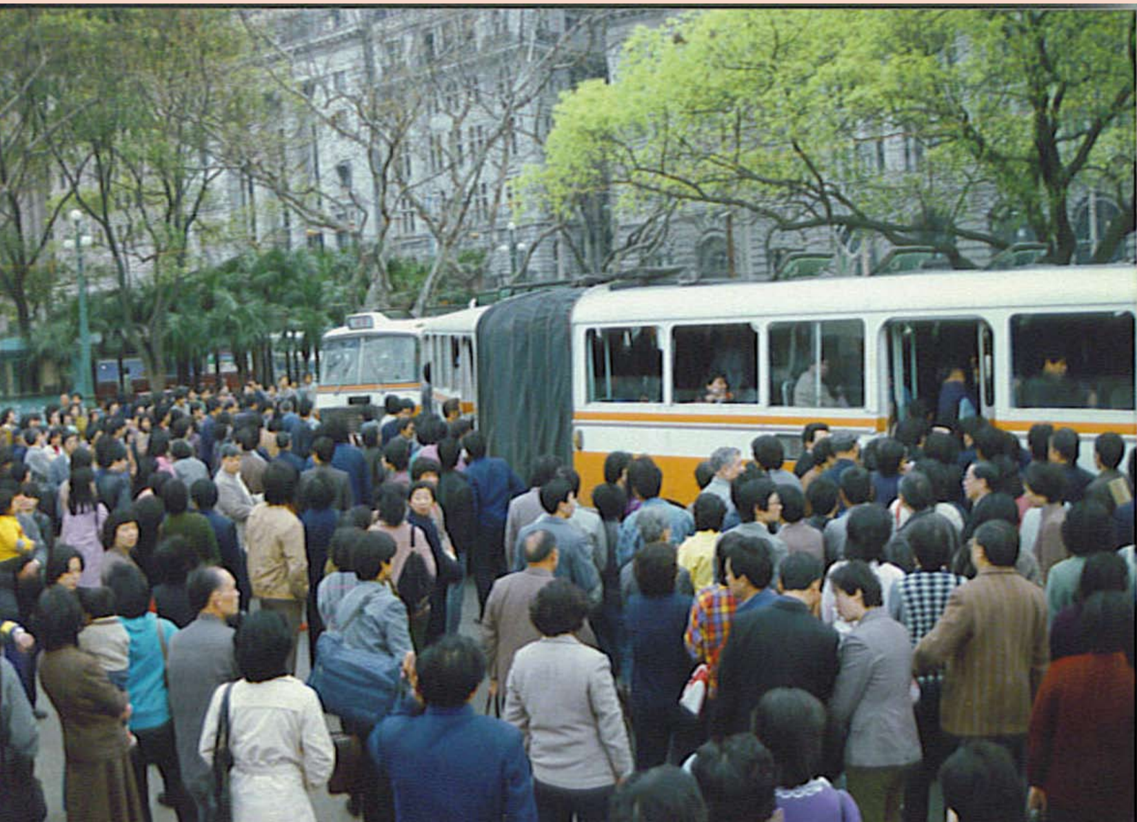
Der Kampf um einen Platz im Bus, 1988