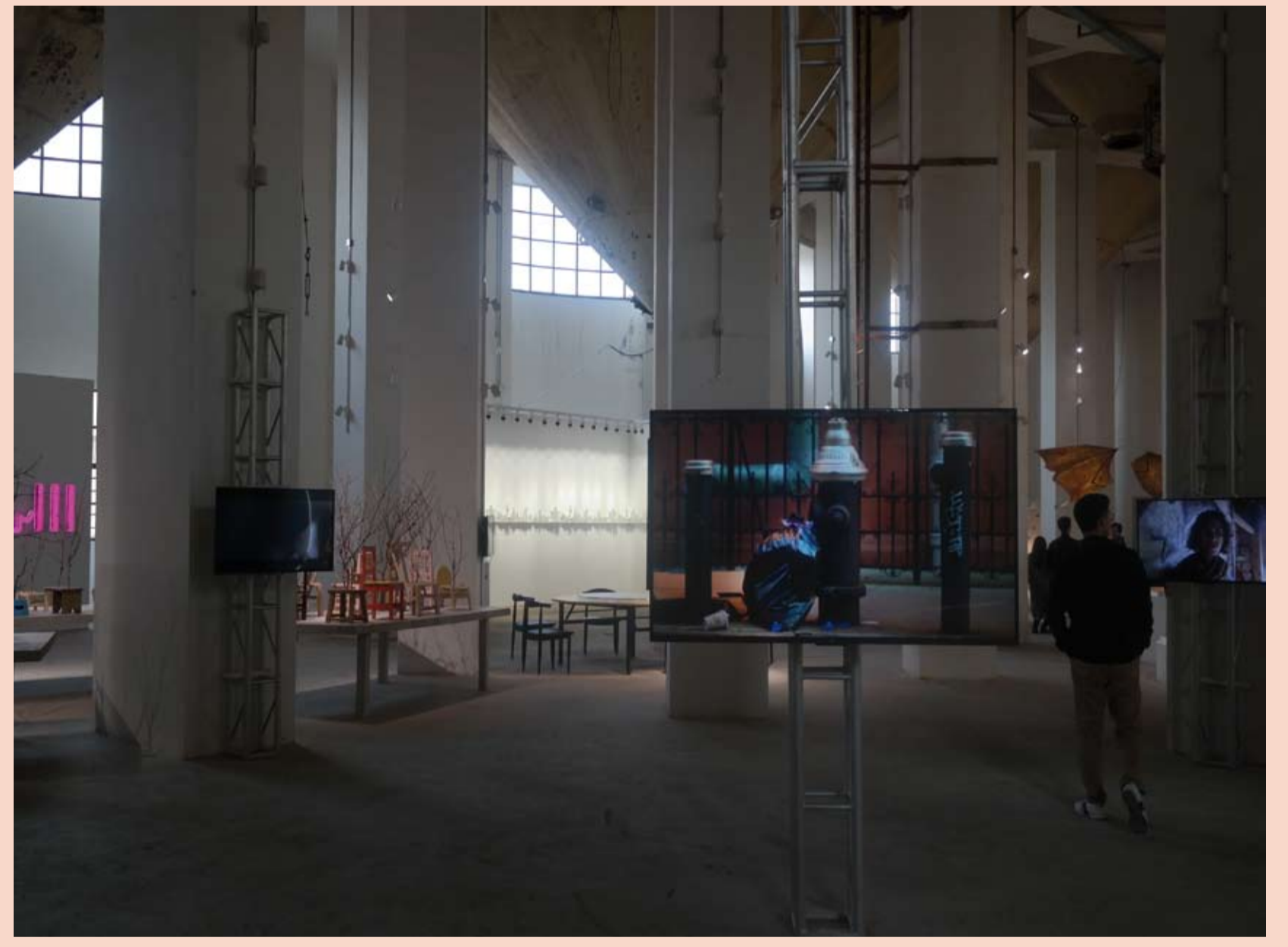
Die Shanghai Urban Space Art Season 2017/8 suchte Wege und Modelle der Stadt der Zukunft. Die Biennale fand in riesigen alten Lagerhallen des Minsheng-Hafens in Pudong statt, die zu einem Kultur- und Kreativzentrum entwickelt werden sollen. www.susas.com.cn