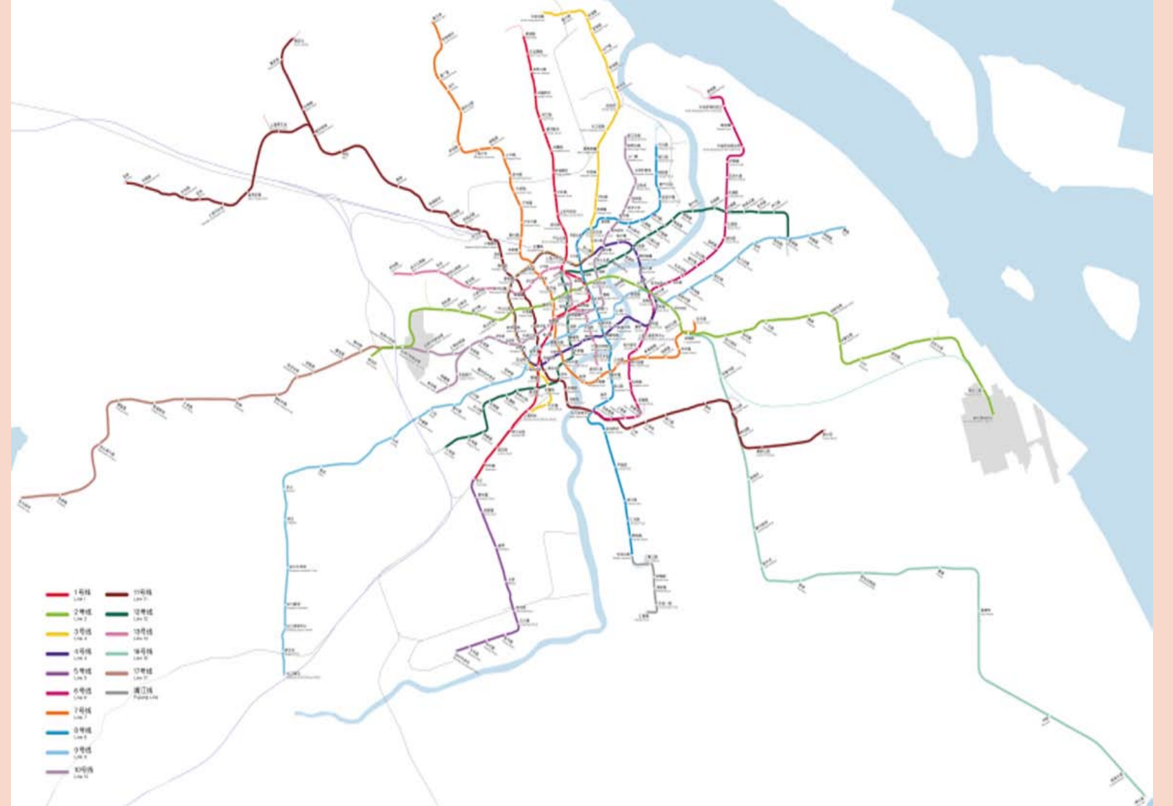
Shanghai, Metronetz 2018